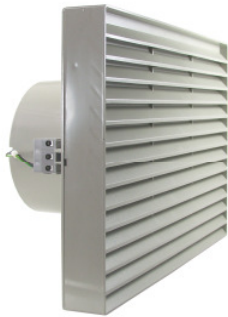
LS 2 K