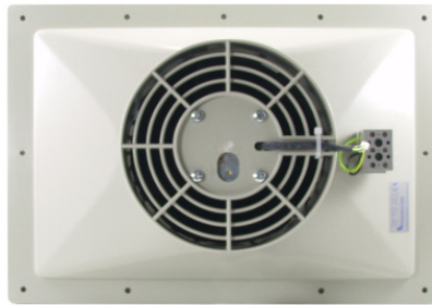
LS 2 (K)